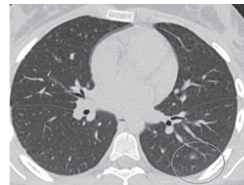
Рисунок 3. КТ ОГК перед выпиской из туберкулезного стационара Figure 3. CT scan of the chest organs before discharge from the tuberculosis hospital

Возбудители паразитозов в 2017 году были обнаружены в почве территорий животноводческих комплексов — 3,3 % (в 2016 г. — 2,21 %, в 2012 г. — 3,5 %), растениеводческих хозяйствах — 3,5 % (в 2016 г. — 2,34 %, в 2012 г. — 1,75 %), селитебной зоне — 1,0 % (в 2016 г. — 1,01 %, в 2012 г. — 1,5 %), в том числе на территориях детских организаций и детских площадок — 0,6 % (в